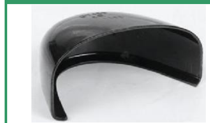
Lámina EVA de 2mm+poliéster .